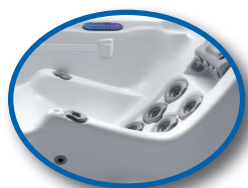
Anti-Floating Sitz Bioform®