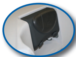
höhenverstellbare Nackensützen NeckFlex®