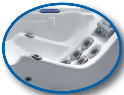
Anti-Floating Sitz Bioform®